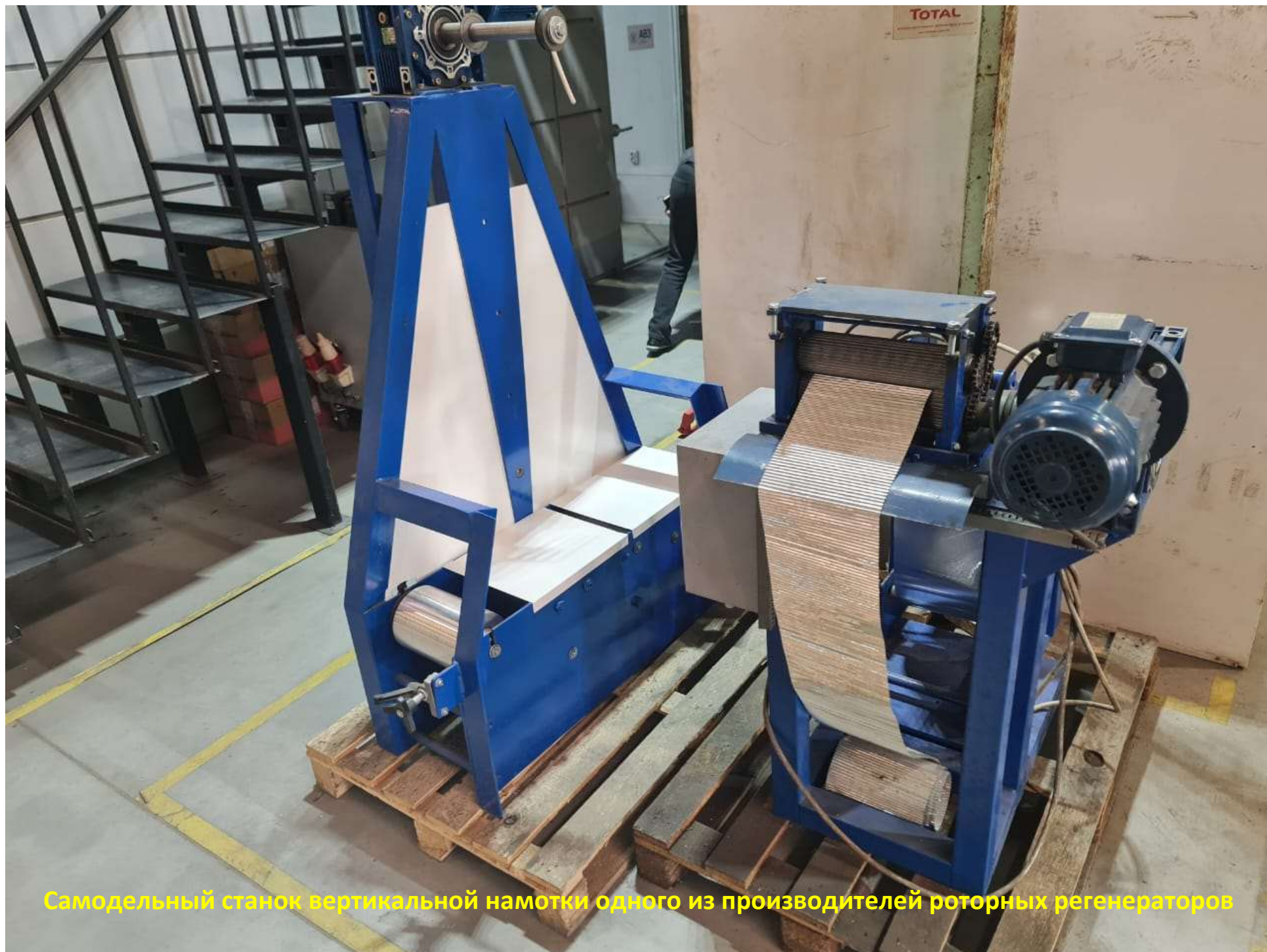
Самодельный станок вертикальной намотки одного из производителей роторных регенераторов