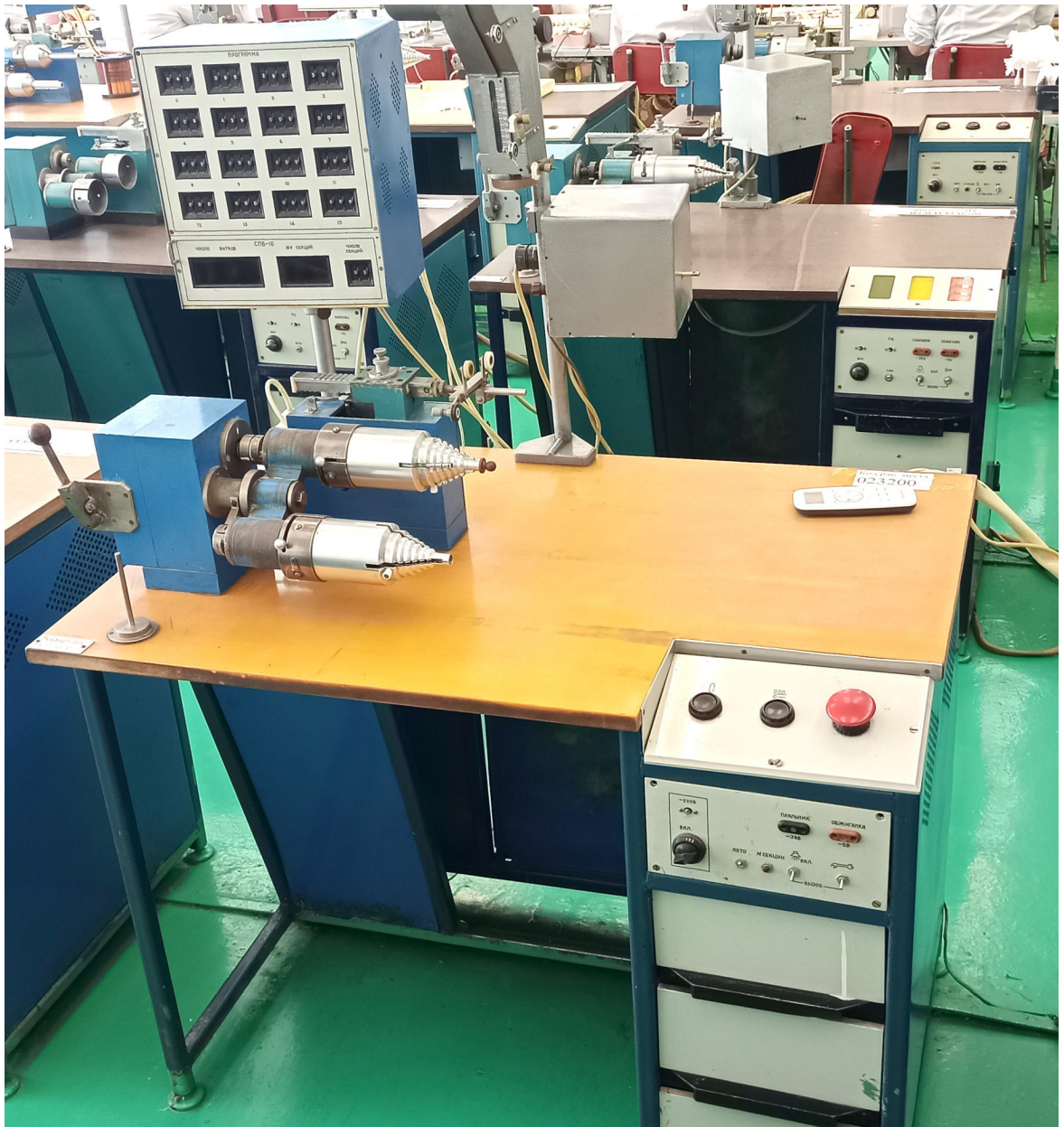
Общий вид станка.