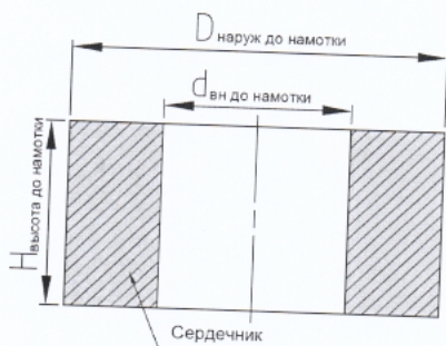
Рисунок 1. Сердечник до намотки