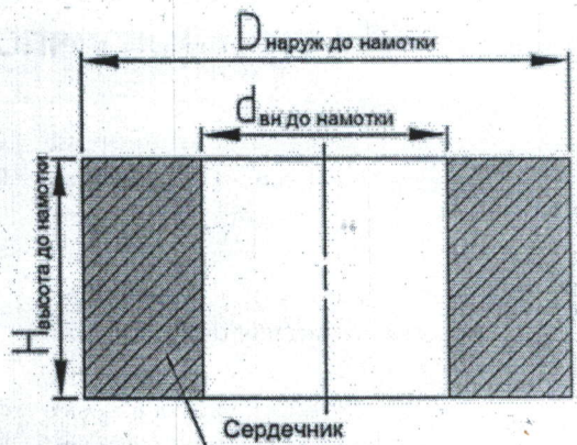
Рисунок 1. Сердечник до намотки