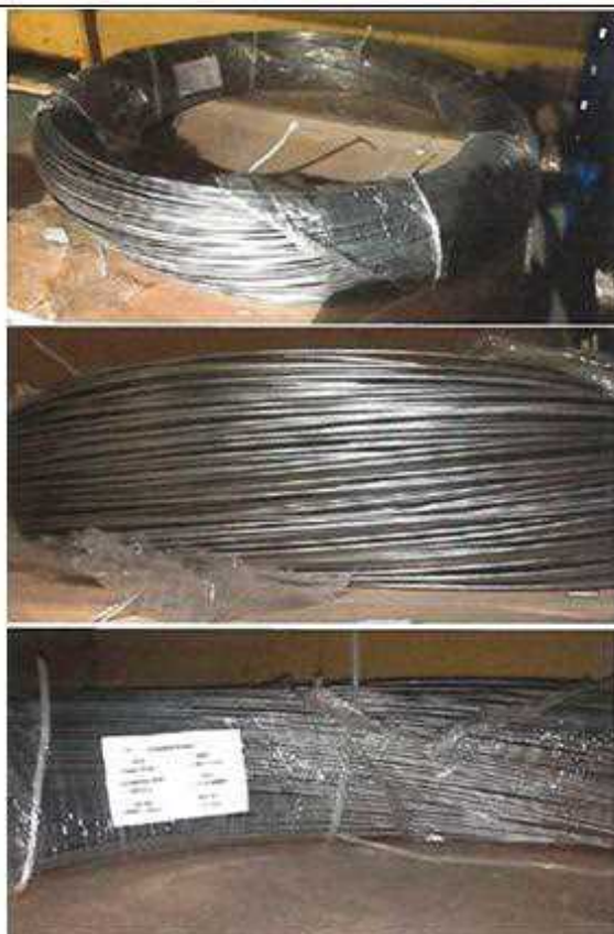
Недопустимая намотка проволоки